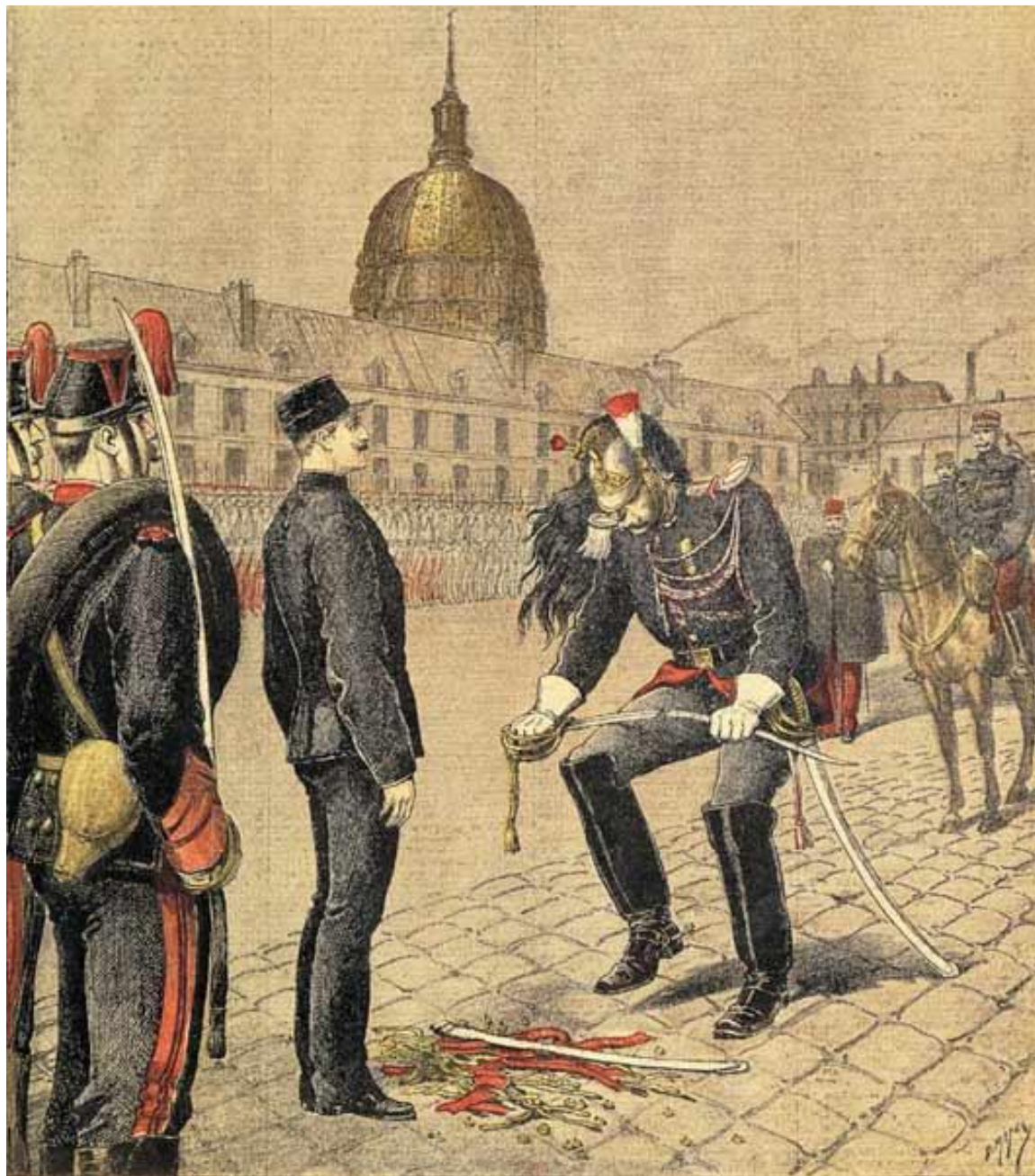
La dégradation d'Alfred Dreyfus, Le Petit Journal , 13 janvier 1895